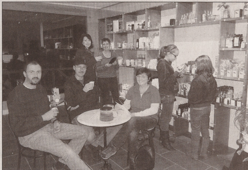
En questa part dalla stizun da Moor a Rabius ei la filosofia da beiber te stada il tema principal al di dallas portas aviartas.

Per ulteriuras informaziuns ed empustaziuns: www.moorstore.ch